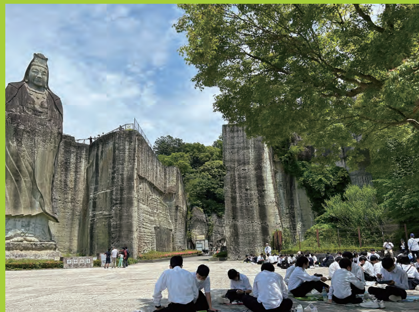
提案型の教育旅行