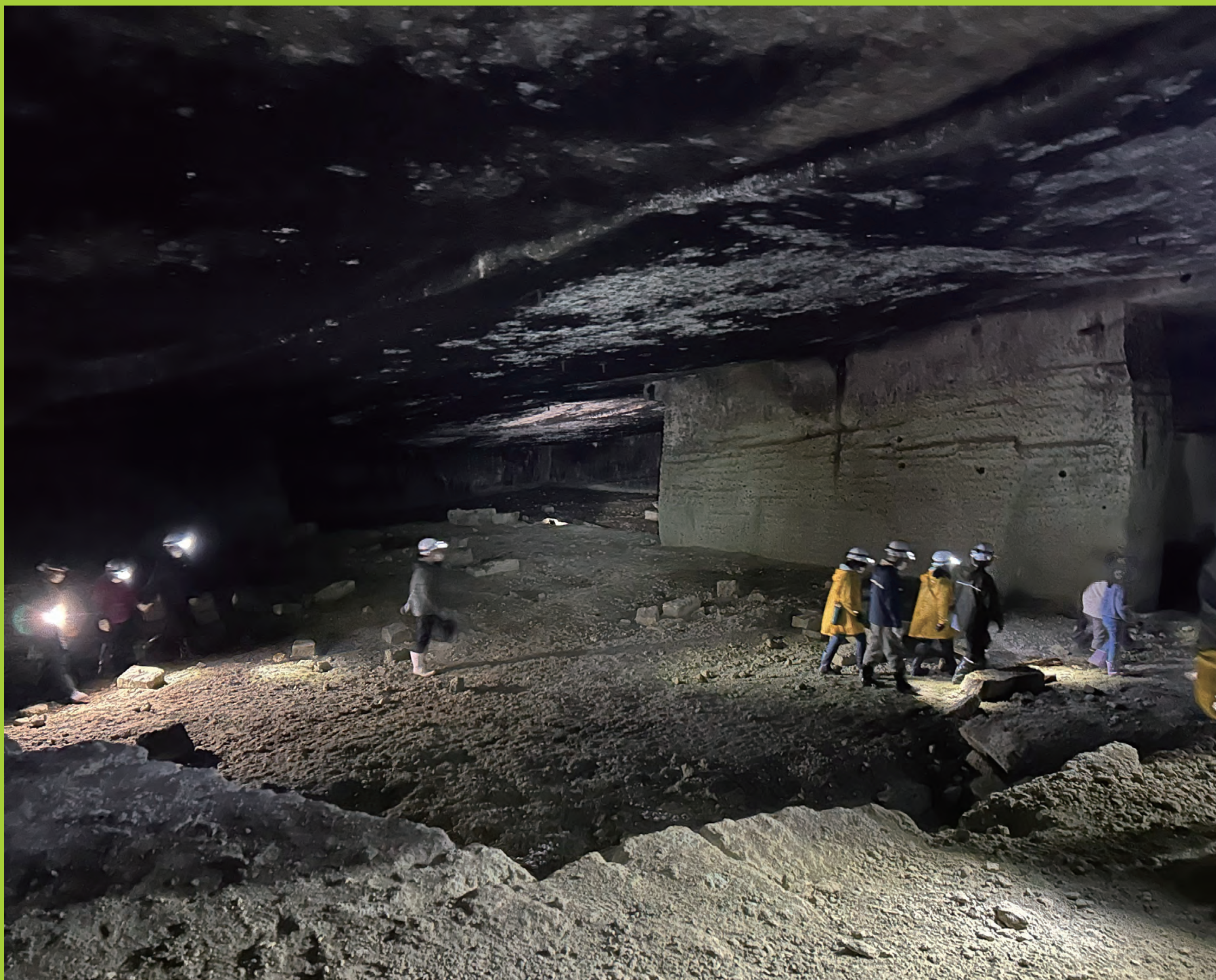
手掘り時代そのままの石切場跡「洞窟 X」を探検