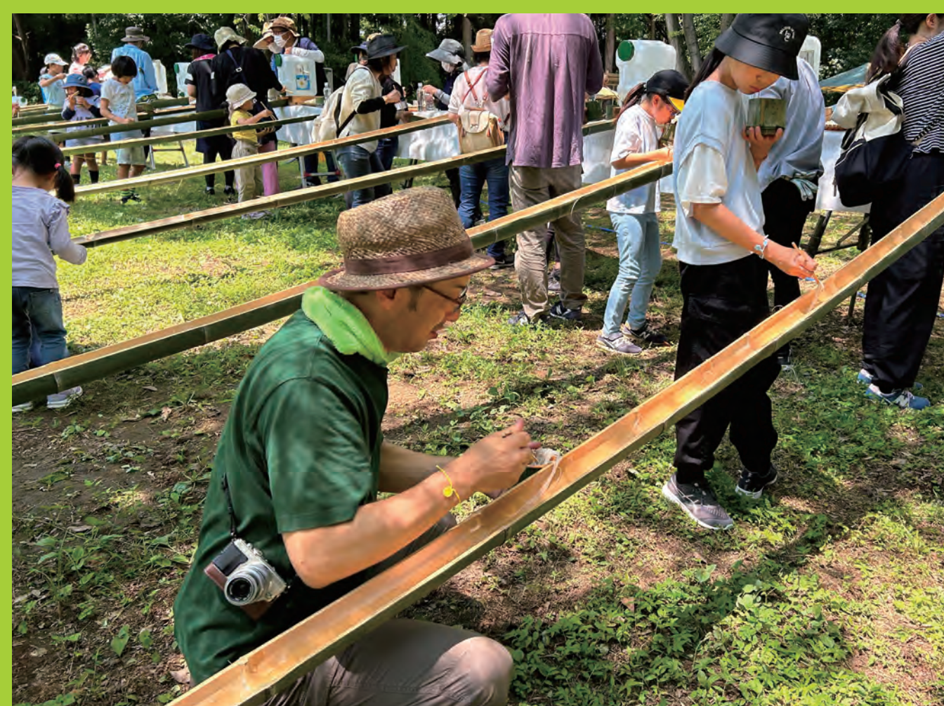
竹切体験で流しそうめん