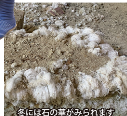
冬には石の華がみられます

100年近く人が入り込まなかった廃採石場への入場を実現。暗闇の洞窟をそれぞれがヘルメットにつけたヘッドライトで進みます。暗闇とライトの灯、大谷石の岩肌、切り残された大谷石の原石たち、これらが醸し出す幻想的な空間。思わず写真に撮ってSNSで紹介したくなるような“映える”風景に出会えます。父の代までこの地で石切職人として働き、大谷石の山に囲まれて育った「大谷の語り部」が手掘りの時代そのままに案内します。洞窟Xへの道は、自然の手つかずのままの山道。苔むした木々が迎えてくれます。