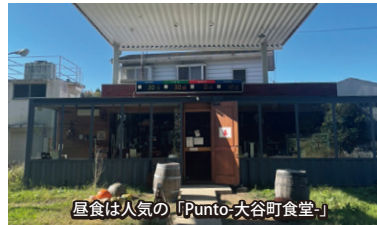
昼食は人気の「Punto-大谷町食堂」