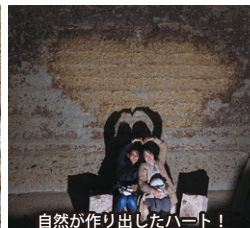
自然が作り出したハート！