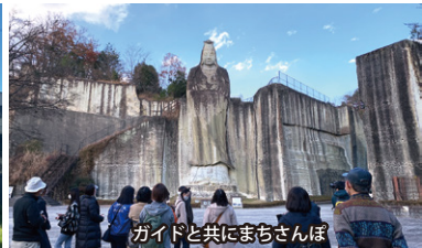
ガイドと共にまちさんぽ