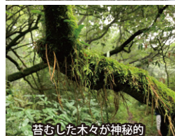
苔むした木々が神秘的